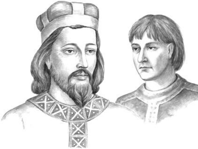
svatý Václav a Boleslav I. Ukrutný

Boleslav nechal razit 1. české mince (stříbrné denáry).