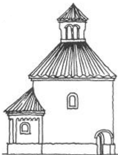
rotunda sv. Kříže v Praze