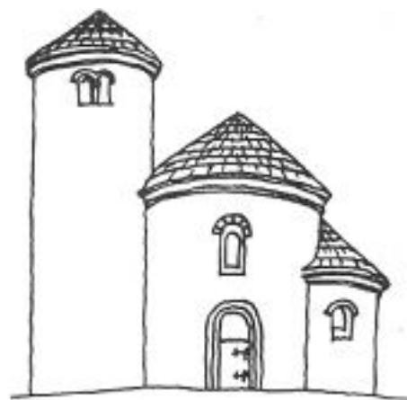
rotunda sv. Jiří na Řípu