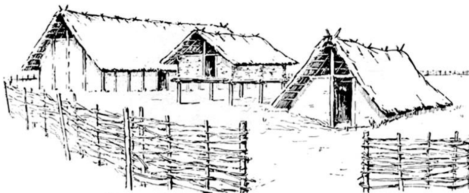
Obytný dům s chlévem, sýpka na kůlech, zahloubená stavba pro tkaní a předení