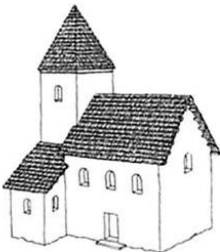
kostel v Mikulčicích