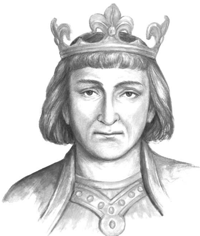
Přemysl Otakar I.