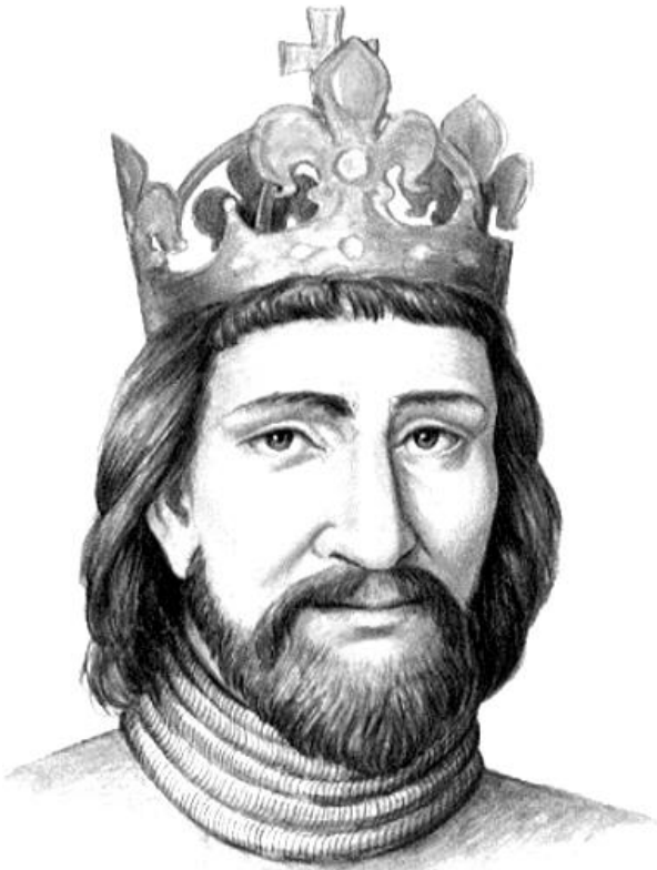
Přemysl Otakar II.