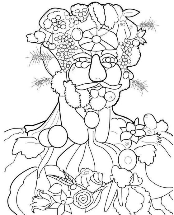
Portrét Rudolfa II. sestavený z květin, ovoce a zeleniny

Po jeho smrti se ujal vlády jeho bratr _____, který