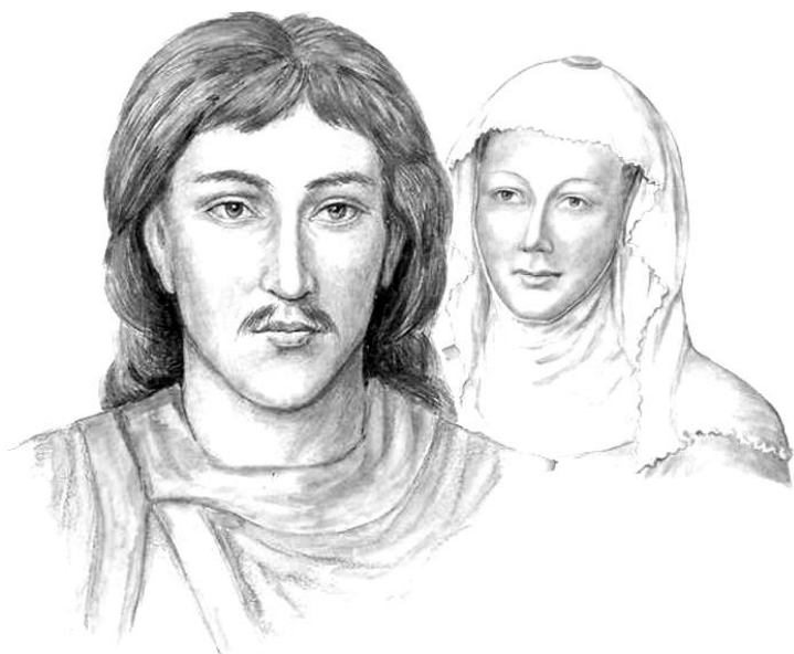
Bořivoj a svatá Ludmila