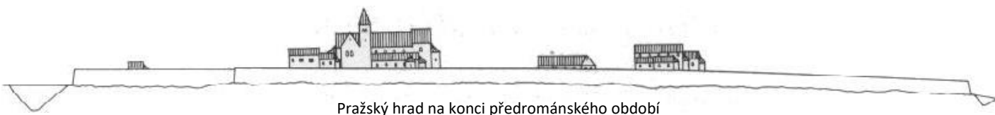
Pražský hrad na konci předrománského období