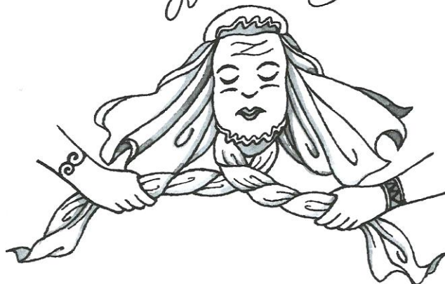
svatá Ludmila byla později zavražděna, stala se 1. českou sveticí