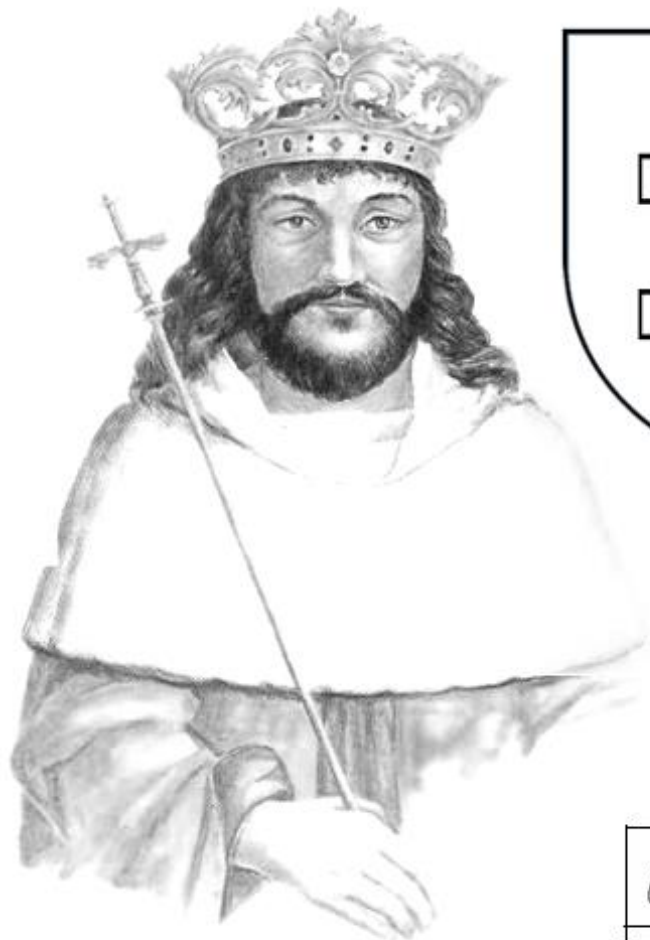
Vladislav II. Jagellonský